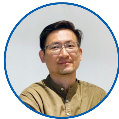
规划与建筑师 打巴控股有限公司

愿景是希望打巴控股能够在国际舞台上，通过实施项目，帮助解决农业领域的挑战和问题。