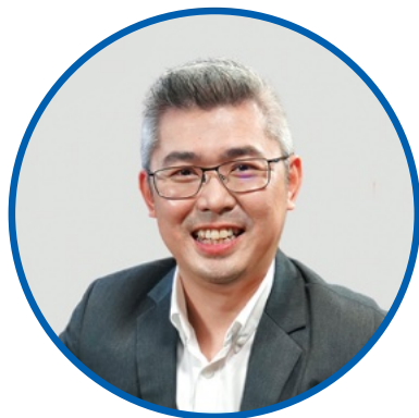
首要执行顾问 BIZSPHERE 品牌与营销集团