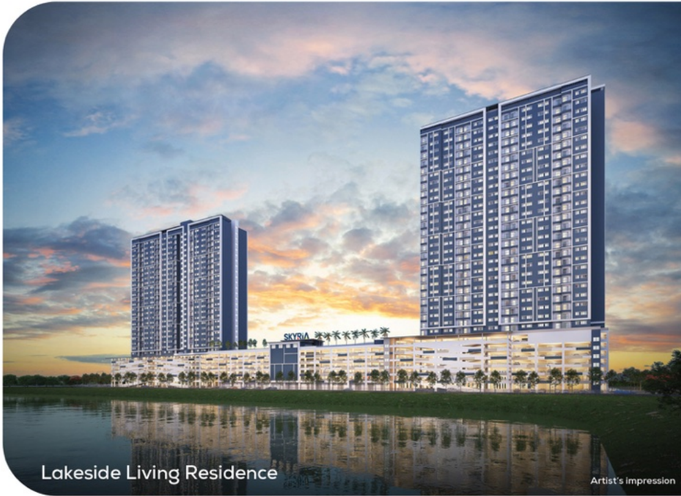
Lakeside Living Residence