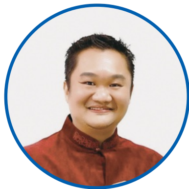
总执行长 FIVE Petroleum Malaysia Sdn Bhd